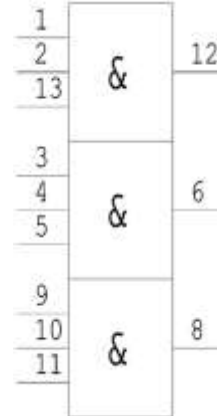
Таблица назначения выводов